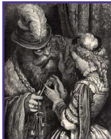
Illustration Gustave Doré