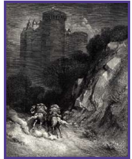
Illustration Gustave Doré

Ces gentilshommes peuvent donc s'unir aux cinq premières épouses de Barbe Bleue – « Idée heureuse /Ingénieuse !/ C'est original/ Et moral ! » commence le chœur, tandis que Boulotte consent à pardonner à son mari.